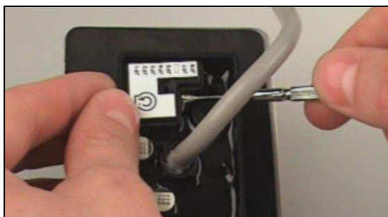
nastavovací prvky chráněny krytkou