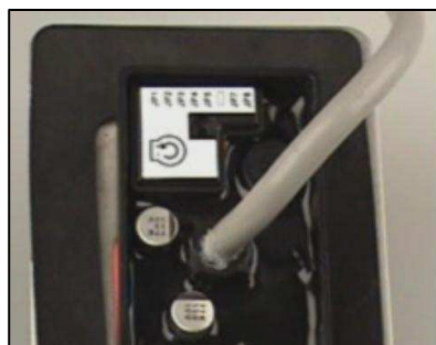
pohled na zadní stranu tlačítka